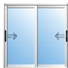
Ventanas de 2 hojas.

La serie está concebida como corredera simple a corte recto, pudiendo realizarse composiciones de 2 hojas, 3 hojas en dos carriles, 3 hojas en 3 carriles, 4 hojas en dos carriles y 6 hojas en tres carriles. Las mismas combinaciones son posibles en puertas balconeras, tiene las mismas hojas con refuerzo, incluso hojas tipo zócalo. Junto con la posibilidad de crear múltiples combinaciones de correderas con fijos en todas sus posiciones, gracias a los marcos fijos diseñados con las características de la serie V-8000. Con gran variedad en doble corredera con rotura en el marco.