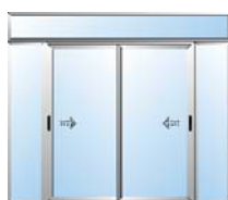
Combinación de ventana y varios fijos.