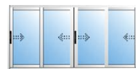
Ventanas en 4 hojas en 2 carriles.