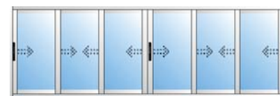
Ventanas de 6 hojas en 3 carriles.