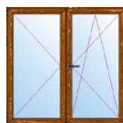
Ventanas de 1 ó 2 hojas con 1 oscilo/batiente.