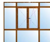
Combinación de ventana y varios fijos. De pequeñas dimensiones