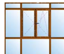
Combinación de ventana y varios fijos. De pequeñas dimensiones.